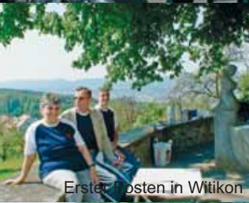
Erster Posten in Witikon