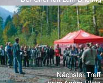
Nächster Treff beim Apéro-Platz