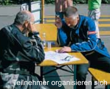
Teilnehmer organisieren sich