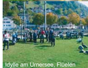
Idylle am Urnersee, Flüelen