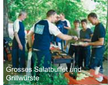
Grosses Salatbuffet und Grillwürste