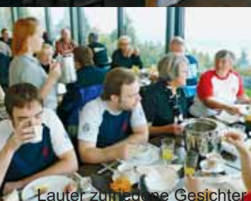
Lauter zufriedene Gesichter