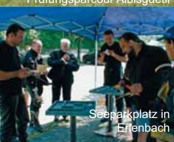
Seeparkplatz in Erlenbach