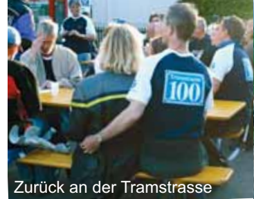
Zurück an der Tramstrasse