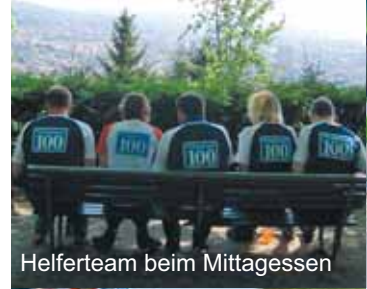
Helferteam beim Mittagessen