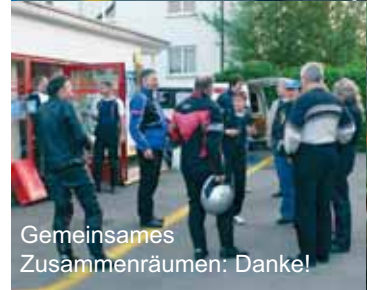
Gemeinsames Zusammenräumen: Danke!