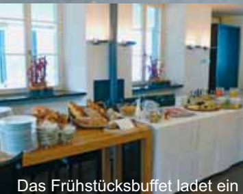
Das Frühstücksbuffet ladet ein