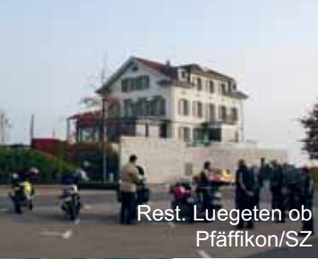
Rest. Luegeten ob Pfäffikon/SZ

Zusammen mit dem Wetter, dem guten Essen und der Superstimmung verging der Tag wie im Fluge. Gegen halb sechs Uhr löste sich die Gesellschaft nach und nach auf. Es war ein Tag voller gelungener Überraschungen: Ich hatte mir «mal wieder was einfallen lassen»... So wurde daraus ein Tag, der zusammen mit dem Super-Wetter kaum zu toppen ist!