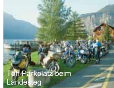
Töff-Parkplatz beim Landesteg