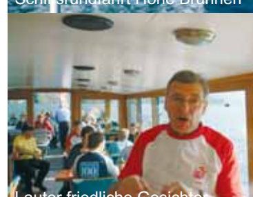
Lauter friedliche Gesichter