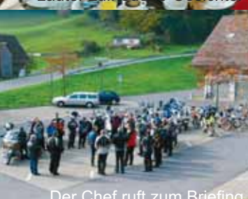
Der Chef ruft zum Briefing