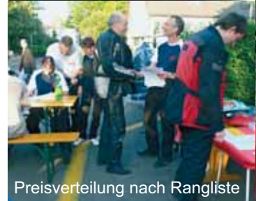
Preisverteilung nach Rangliste