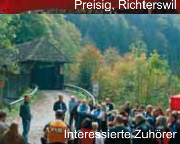
Interessierte Zuhörer lauschen...