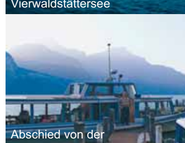
Abschied von der «Wilhelm Tell»