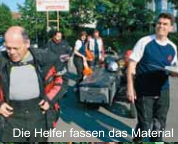
Die Helfer fassen das Material