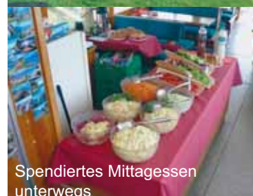
Spendiertes Mittagessen unterwegs