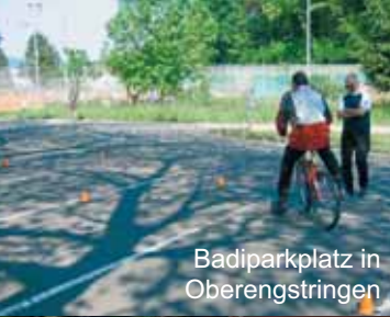
Badiparkplatz in Oberengstringen