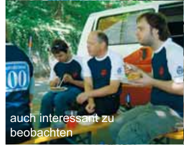
auch interessant zu beobachten