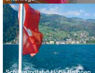
Schiffsrundfahrt Höhe Brunnen