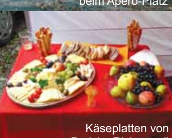
Käseplatten von Preisig, Richterswil