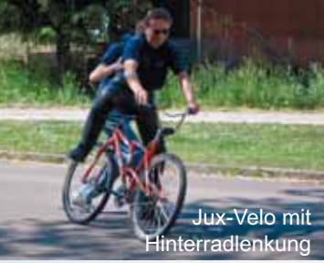
Jux-Velo mit Hinterradlenkung