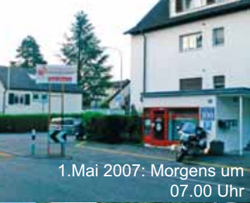
1. Mai 2007: Morgens um 07.00 Uhr