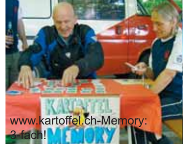
www.kartoffel.ch -Memory: 3-fach!