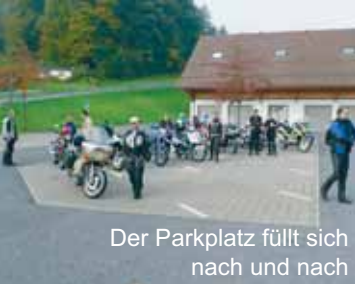
Der Parkplatz füllt sich nach und nach