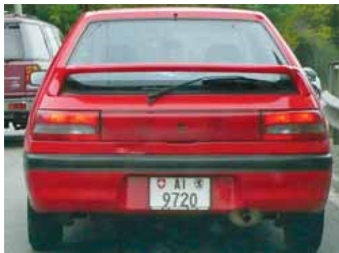
Richtige Innerrhändler haben 4-stellige Nummernschilder