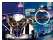
Honda 6-Zyl. Boxer Designstudie EVO6 ... es fehlt der Kupplungshebel: GoldWing-Automat?

Seit 31 Jahren fahre ich GoldWing und war damals mit 22 Jahren bestimmt einer der jüngsten GoldWing-Fahrer. Es war damals die grösste Maschine, mit am meisten Kubik, Leistung und Gewicht. Entscheidend für mich war, dass ich eine Langstreckenmaschine suchte mit Wasserkühlung und Kardan, aus japanischer Herstellung. Nur die Honda GoldWing GL1000 erfüllte alle drei Bedingungen. Inzwischen bin ich über 450'000 GoldWing-Kilometer gefahren und werde wahrscheinlich nochmals eine GoldWing (... dann wohl die letzte!) für mich kaufen: Nicht weil sie die Grösste, Stärkste oder Gewichtigste sein wird – sondern weil ich nicht auf die Zuverlässigkeit und den Komfort zu zweit verzichten möchte. Allerdings gibt es sie noch nicht zu kaufen, denn es muss eine GoldWing-Automat sein – und seit mehr als 15 Jahren lässt mich Honda darauf warten. Ein kleiner Lichtblick: An der SwissMoto '08 zeigte Honda ein «Concept-bike» mit 6-Zylinder-Boxer-Motor ohne Kupplungshebel... – wer weiss, vielleicht werde ich für mein langes Warten eines Tages belohnt. Auch mit 203'000 km auf dem Tacho läuft meine GoldWing Aspencade mit Jahrgang 1985 bis dahin munter weiter. Meinen täglichen Fahrspass aber genieße ich mit der mir geschenkten BMW R80GS mit Jahrgang 86 und unbekannter Laufleistung! Oft ist weniger mehr!!!