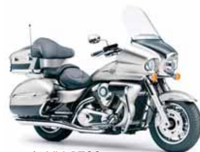
Kawasaki VN 1700

bei nicht übers Vorderrad überschlägt. Und genau dies dürfte der heisse Punkt sein, wenn man einen Vorderrad-lastigen Supersportler vehement zum Stehen bringen will. Ich bin gespannt auf die ersten Testfahrten der Journalisten mit diesen Systemen. Motorräder flott zu bewegen ist in erster Linie davon abhängig, wie ausbalanciert die Maschine ist. So ist es nicht verwunderlich, dass unter extremen Bedingungen, wie sie beispielsweise auf den holprigen Passstrassen anzutreffen sind, nicht unbedingt