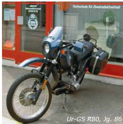
Ur-GS R80, Jg. 86

Die Frage, die sich der Käufer einer Maschine stellen muss, ist also: Will ich einen Töff kaufen, der mir selbst viel Spass bereitet, Fahrspass pur – oder will ich mir einen Töff kaufen, mit dem ich gut aussehe, fast wie die «fast boys» im sonntäglichen Rennen am Fernsehen? Oder will ich damit die Sehnsucht nach amerikanischen Distanzen und der sprichwörtlichen Freiheit stillen, oder in der Stammtischrunde mit Kubik-, Leistungszahlen protzen oder mit dem horrenden Kaufpreis, der mich zum glorreichen Selbstdarsteller kürt bis ich von einem anderen in den Schatten gestellt werde, mit der berühmten «2» am Rücken?