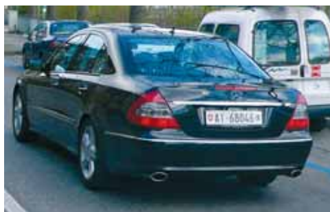
An den 5-stelligen AI-Schildern zu erkennen: Mietautos