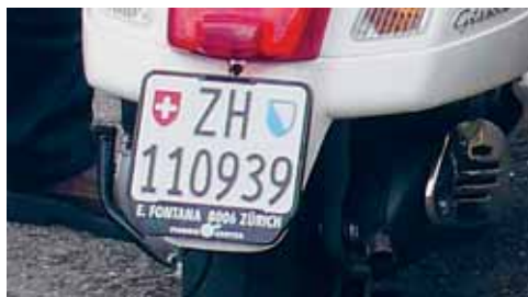
Gelbe Motorradschildern für 50-Kubik-Roller und -Motorräder abgeschafft, 6-stellige weisse Nummernschilder im Kanton Zürich erforderlich