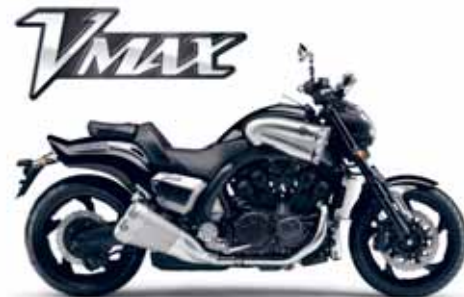
Yamaha V-max 2009

Was mir viel mehr Eindruck macht, ist die Bedeutung von ABS: Honda hat als erste Marke ein CBS-ABS vorgestellt, dass in den (renn)sportlichen Modellen verbaut werden soll. Denn nicht bei allen Marken hat bisher ABS für einen kürzeren Bremsweg gestanden, auch war es nicht unbedingt möglich, zu garantieren, dass sich die Maschine da-