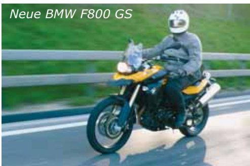
Neue BMW F800 GS

Die Frage, die sich der Käufer einer Maschine stellen muss, ist also: Will ich einen Töff kaufen, der mir selbst viel Spass bereitet, Fahrspass pur – oder will ich mir einen Töff kaufen, mit dem ich gut aussehe, fast wie die «fast boys» im sonntäglichen Rennen am Fernsehen? Oder will ich damit die Sehnsucht nach amerikanischen Distanzen und der sprichwörtlichen Freiheit stillen, oder in der Stammtischrunde mit Kubik-, Leistungszahlen protzen oder mit dem horrenden Kaufpreis, der mich zum glorreichen Selbstdarsteller kürt bis ich von einem anderen in den Schatten gestellt werde, mit der berühmten «2» am Rücken?