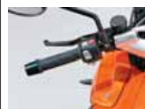
Abkehr vom eigenwilligen BMW-Blinkersystems bei den neuen K1300-Modellen, Blinkerschalter links wie alle übrigen Marken es als Standard führen.

so schnell fahren können! Aber auch die Sporttourer lassen sich nicht lumpen und so bietet BMW bei seinen neuen K1300-Modellen nun 175 PS an, egal ob naked, Sportler oder Tourer – eine Marke, die vorher nicht unbedingt einen Namen hatte für maximale PS-Zahlen.