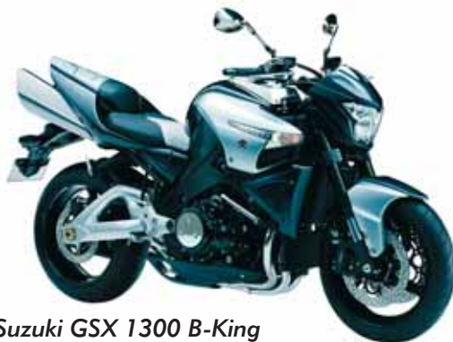
Suzuki GSX 1300 B-King

Wieviel Motorrad braucht der Mensch? Diese Frage wird auf der nebenstehenden Seite abgehandelt. Der Markt liefert, was gefragt ist – und so hat das Aufrüsten auch in der Zweiradbranche kein Ende: Immerhin riegheln die Töffs bei 300 km/h nun elektronisch ab und damit soll das Wettrüsten zumindest in der Höchstgeschwindigkeit aufhören. Wer's glaubt...?!?