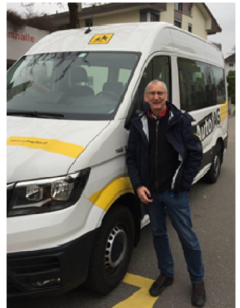
The area: Forch-Küsnacht ZH

Now to the planning for 2025: As in the previous year, I will again be offering the KT1 course (possible from 4 participants, also for groups/clubs by arrangement), the KT2 course and, in collaboration with "moto-trainingskurse.ch", the advanced training course in Interlaken. I am available for driving lessons to all those learner drivers with whom I have already completed initial training in a lower category. Outside of the school vacations, this will only be possible on Saturdays, or Sundays in extreme emergencies. With this letter I would like to call on everyone to contact me with their wishes.