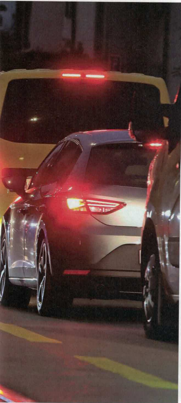
Stau auf Autobahnen führt zu Ausweichverkehr, der – wie hier in der Stadt Zürich fotografiert – wiederum zu mehr Stau, Lärm, Feinstaubbelastung und auch Unfällen führt.

40 Prozent des Individual- und rund 70 Prozent des Güterverkehrs trägt. Aber Fakt ist auch, dass sich das Verkehrsaufkommen seit den 1990er-Jahren u.a. wegen des Bevölkerungszuwachses verdoppelt hat und das Nationalstrassennetz somit klar an eine Kapazitätsgrenze gestossen ist. Die zunehmenden Staus führen nun dazu, dass sich der Verkehr seinen Weg immer intensiver durch die Agglomerationen, Quartierstrassen und Dörfer sucht, was dort zu mehr Lärm, Abgasbelastung, Feinstaub sowie Stau führt. Und wo Stau ist, kommt es zu mehr Unfällen.