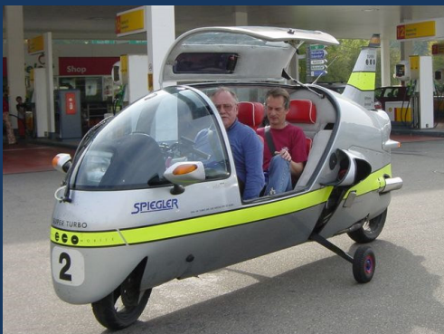
Seite noch in Arbeit!