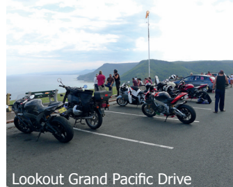
Lookout Grand Pacific Drive