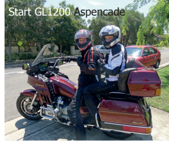
Start GL1200 Aspencade