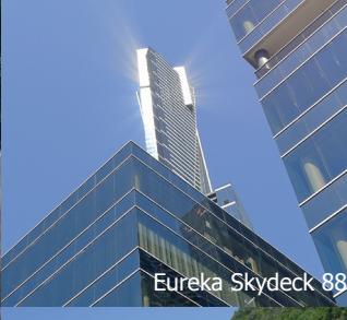
Eureka Skydeck 88