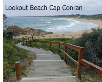
Lookout Beach Cap Conran