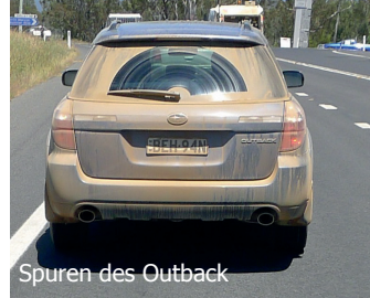
Spuren des Outback