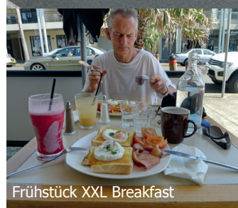
Frühstück XXL Breakfast