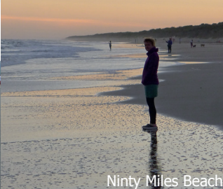
Ninty Miles Beach