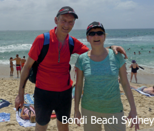
Bondi Beach Sydney