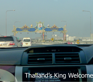
Thailand's King Welcome