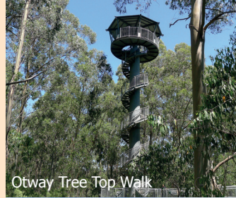
Otway Tree Top Walk