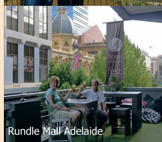
Rundle Mall Adelaide