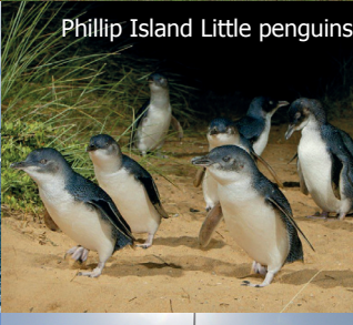
Phillip Island Little penguins