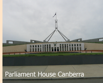
Parliament House Canberra