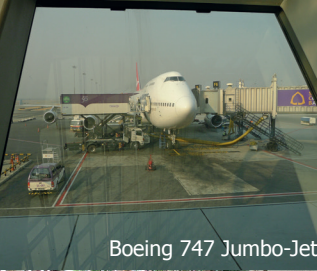
Boeing 747 Jumbo-Jet