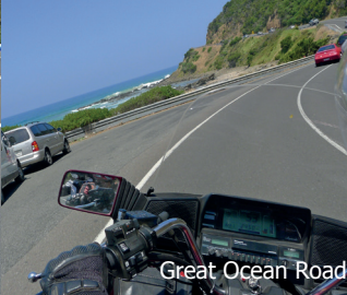
Great Ocean Road