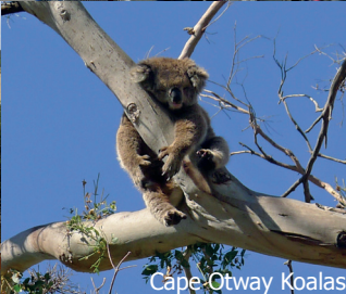
Cape Otway Koalas