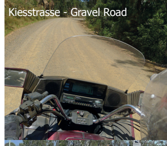
Kiesstrasse - Gravel Road