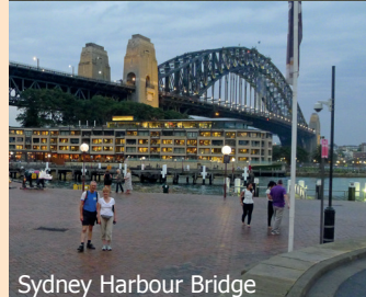
Sydney Harbour Bridge