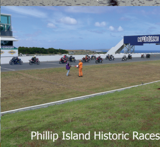
Phillip Island Historic Races