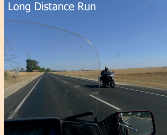
Long Distance Run