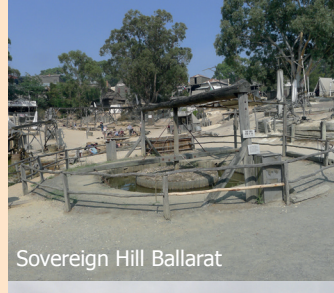
Sovereign Hill Ballarat