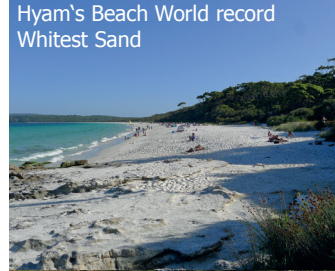
Hyam's Beach World record Whitest Sand