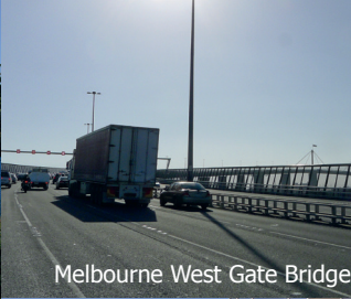
Melbourne West Gate Bridge